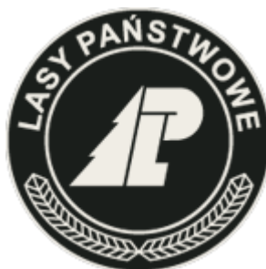
Nadleśnictwo Lidzbark i Dwukoły.