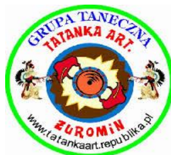
ŻUROMIŃSKIE CENTRUM KULTURY.